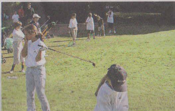
Giovanissimi impegnati sui campi da golf della nostra provincia

Più di 400 ragazzi/e (6-18 anni) protagonisti del 3 o U.S. Kids Venice Open nei tre circoli della provincia