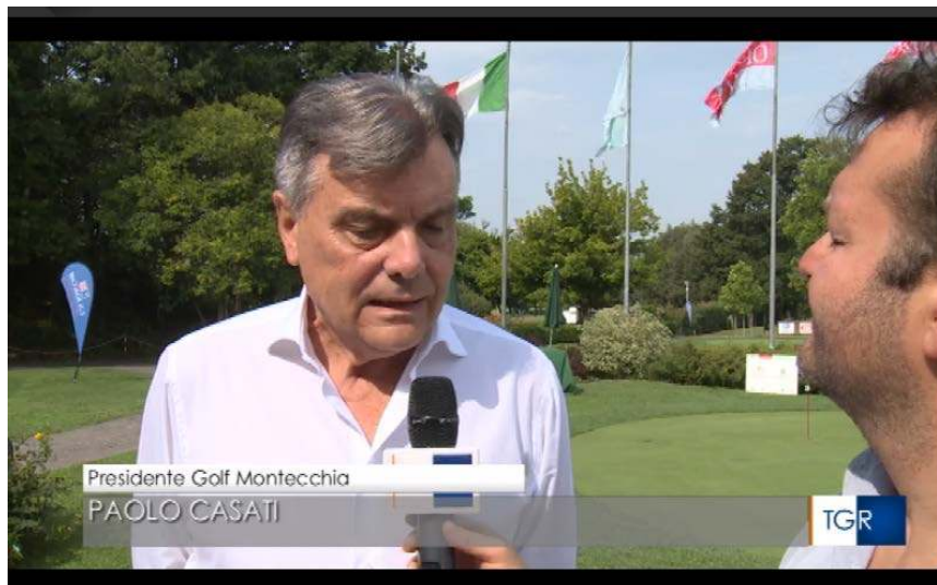
TG Veneto Edizione delle 19.30

http://www.rainews.it/dl/rainews/TGR/multimedia/ContentItem-ffd17d25-0257-4c52-8dd4-01f3092c3032.html