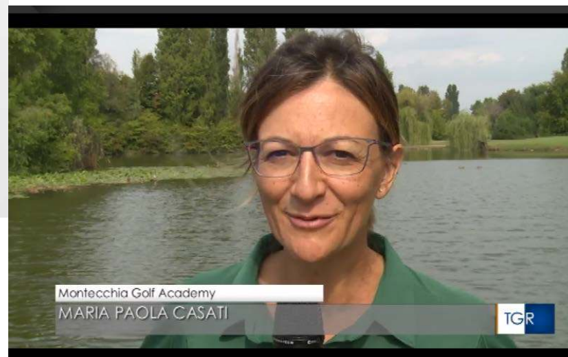
TG Veneto Edizione delle 19.30