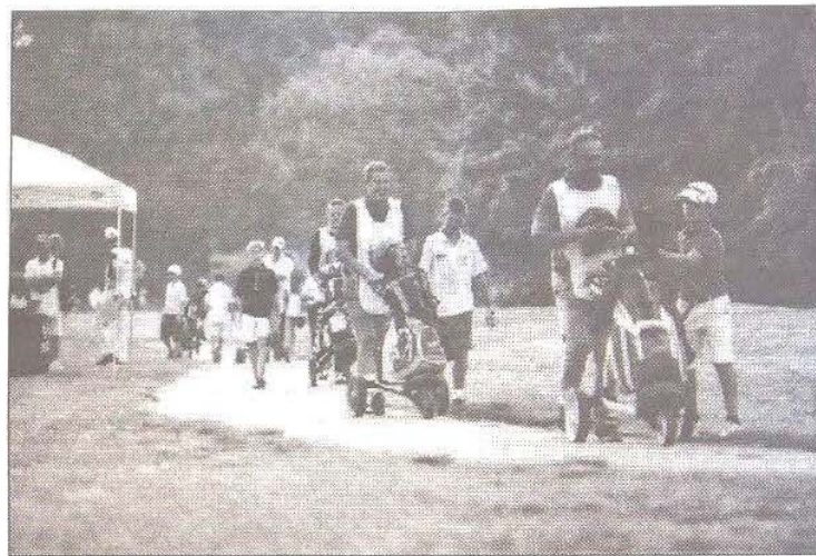
IN CAMPO AL CONTRARIO Piccoli giocatori e caddies "grandi" nel Kids Open

Il Venice Open si propone anche come "Evento Eco-Sostenibile", primo a farlo in Europa tra i tornei giovanili di golf, mirando al rispetto della natura con trasporti organizzati, raccolta differenziata, riciclo dei rifiuti, uso di prodotti locali e di energie da fonti rinnovabili.