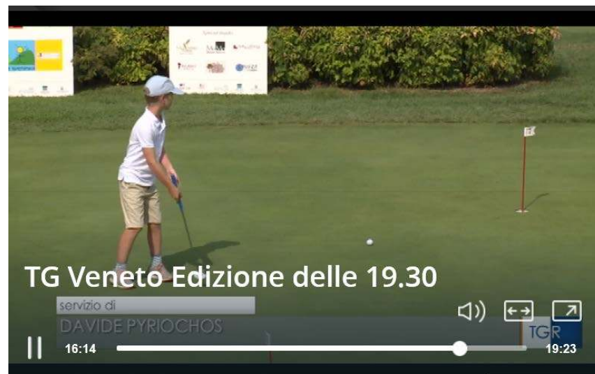
TG Veneto Edizione delle 19.30